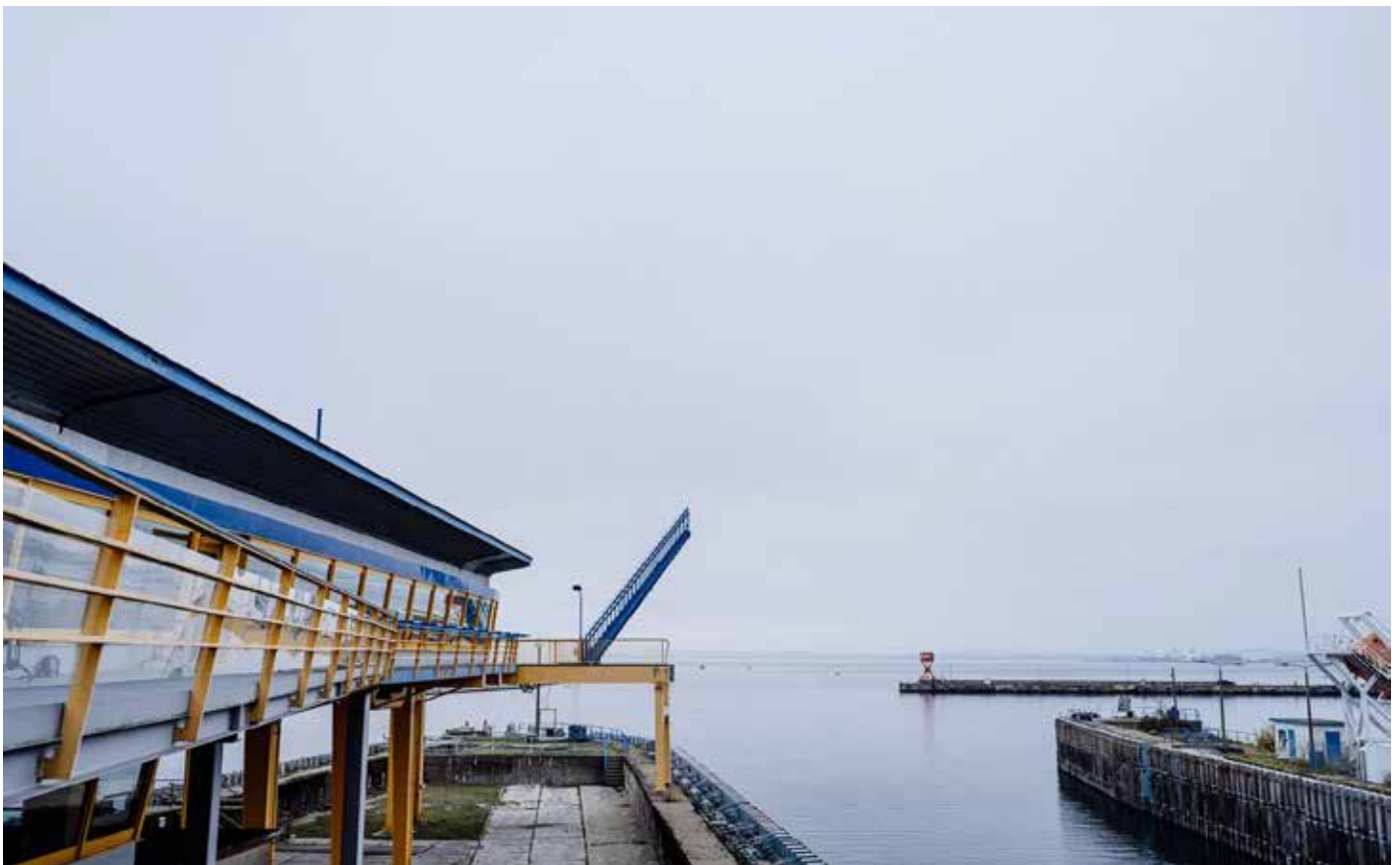
Logogestaltung und Plakate: Axel Völker, redaktionundgestaltung.de